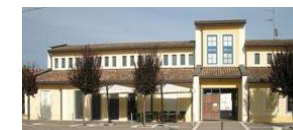
Ass.ne Anziani SISSA APS